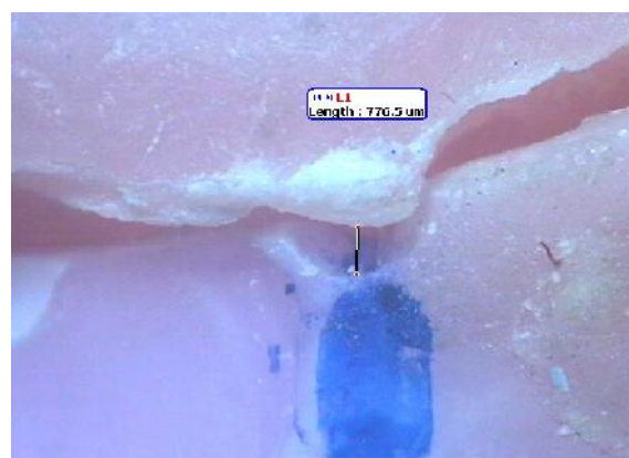
شکل ۴- درز بین بیس ریلاین شده و مدل اصلی در زیر میکروسکوپ

یافته‌های حاصل از این مطالعه که دقت ابعادی دو روش ریلاین مستقیم و غیرمستقیم را مورد ارزیابی قرار داد، مشخص نمود که روش مستقیم به صورت معنی‌داری دقت ابعادی بیشتری در مقایسه با روش غیرمستقیم دارد. ناحیه تریگوماگزیلاری ناچ بیشترین میزان و ناحیه میدپالاتال کمترین میزان دقت ابعادی را در مقایسه با سایر نقاط ناحیه سد کامی- خلفی دارد.