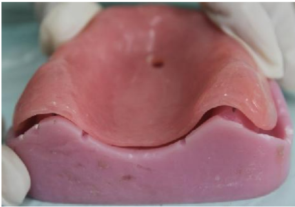
شکل ۲- فاصله ایجاد شده برای قرارگیری ماده ریلاین