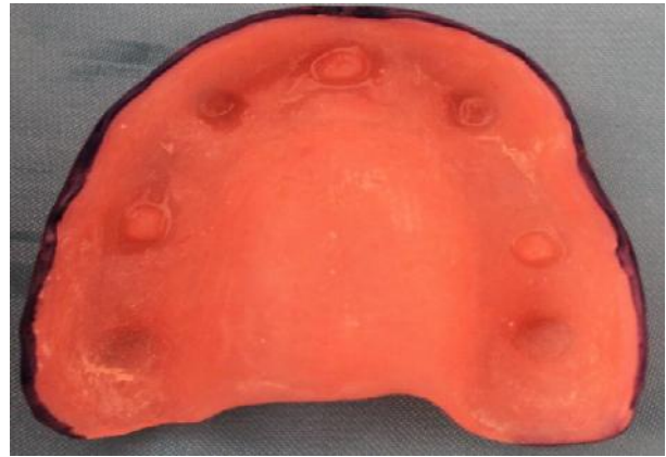
شکل ۱- نمای داخلی دنچر بیس پخته شده تصویر