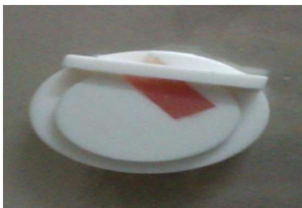
شکل ۱- آماده‌سازی نمونه داخل مولد

ابتدا برای یکسان‌سازی تمامی نمونه‌ها با استفاده از دستگاه برش (ISOMET low speed saw, Buehler, Germany) به میزان ۲ میلی‌متر از سطح Ridge lap برداشته شد تا سطحی صاف ایجاد شود. سپس نمونه‌ها با آب تمیز شد و در مولدی از جنس تفلون که از قبل با طراحی خاص برای این کار ساخته شده و برای کنترل محل اتصال به وسیله آن نمونه‌ها با سطح مقطع ۲۵ میلی‌متر مربع به آکریل خودبه‌خود پلیمریزه شونده باند شدند. بدین‌صورت که ابتدا رزین خودبه‌خود پلیمریزه شونده (Rapid repair, Dentsply, England) طبق دستور کارخانه سازنده مخلوط شده و در مرحله خمیری (Dough) در داخل مولد پک شد. دندان مصنوعی موردنظر در جایگاه خاصی از مولد که با زاویه ۱۳۵ درجه (زاویه دندان‌های اینسایزور فک بالا نسبت به دندان‌های اینسایزور فک پایین در اکلوزن نوع I) تعبیه شده، به آکریل خودبه‌خود پلیمریزه شونده (Rapid repair, Dentsply, England) چسبانده شد و نمونه روی میز کار نگه داشته شد تا پلیمریزاسیون کامل شود (شکل ۱) و سپس از مولد به دقت خارج گردید (شکل ۲).