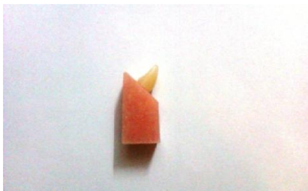
شکل ۲- نمونه آماده شده

شبه‌سازی محیط دهانی با انجام ترموسایکلینگ (ایجاد حرارت و رطوبت مشابه محیط دهان) و Cyclic loading (اعمال نیروهای جویدن) انجام نشده است که ما در تحقیق حاضر مدنظر قرار داده‌ایم (۱۷). با توجه به کاستی‌های فوق و اظهارات کارخانه‌های سازنده دندان مصنوعی کامپوزیتی مینی بر بیشتر بودن زیبایی این دندان‌ها و قابل مقایسه بودن سایش آنها با دندان‌های آکریلی، این تحقیق با هدف مقایسه تأثیر ۴ نوع دندان مصنوعی (دندان‌های کامپوزیتی (مونولیتیک) و آکریلی (مونولیتیک) Ideal makoo و Ivoclar) با و بدون Cyclic loading بر میزان استحکام باند در آکریل بیس دنچر خودبه‌خود پلیمریزه شونده در بخش پروتز متحرک دانشکده دندانپزشکی دانشگاه آزاد اسلامی طراحی و اجرا شد. با امید به این که نتایج این تحقیق در انتخاب نوع دندان و آکریل بیس مفید واقع شود.