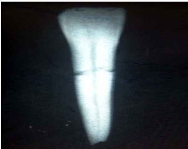
شکل ۱- نمای رادیوگرافیک نمونه شماره ۱ در حالت دندان به تنهایی

در مرحله بعد برای مشاهده بهتر خط شکستگی دور تا دور خط شکستگی با ماژیک ضد آب علامت‌گذاری شد و پس از انطباق کامل، دو قطعه با استفاده از چسب سیانوآکریلات به هم متصل شدند. برای حفظ تطابق هرچه بیشتر دو قطعه شکسته شده هر دندان ابتدا دو قطعه در کنار هم قرار داده شد و چسب سیانوآکریلات در پیرامون محل شکستگی قرار گرفت. چسب سیانوآکریلات، دارای ویسکوزیته پایین بوده و تطابق دو قطعه را به خطر نمی‌اندازد. این چسب فاقد ترکیبات فلزی است و در رادیوگرافی رادیولوسنت و غیرقابل رویت است. سپس