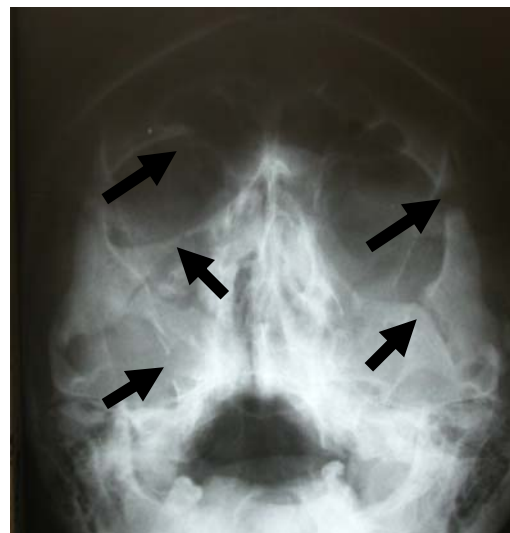
شکل ۱- رادیوگرافی واترز، فلشها محل شکستگیها را نشان می‌دهد

اطلاعات مربوط به هر بیمار در فرم اطلاعاتی تهیه شده ثبت و یافته‌ها توسط نرم افزار SPSS مورد بررسی قرار گرفت، سپس حساسیت و ویژگی نواحی چپ و راست ناحیه اوربیت، گونه و سینوس ماگزایلا در هم ادغام و به صورت یک عدد کلی بیان شد.