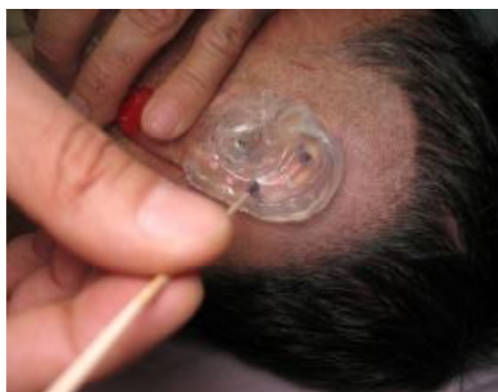
شکل ۷- استفاده از استنت حین جراحی