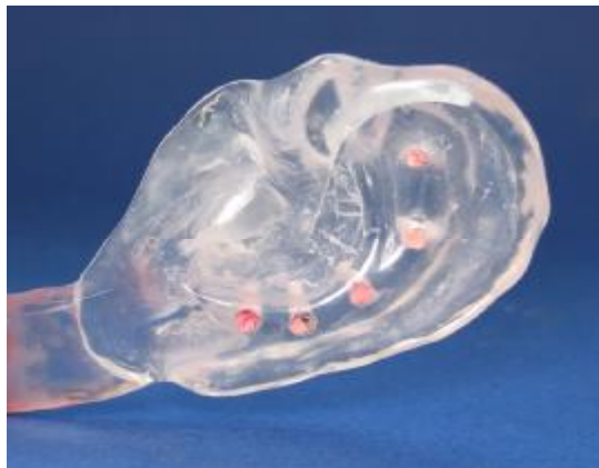
شکل ۵- ایجاد ۵ عدد سوراخ در ناحیه آنتی هلیکس استنت