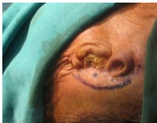
شکل ۸- نواحی علامتگذاری شده با متیلن بلو بر روی پوست

پروتزهای جایگزین گوش می‌توانند نتایج زیبایی خوبی به همراه داشته باشند. متأسفانه استفاده از مواد آدهزیو به دلیل وجود مو و فقدان ناهمواری آناتومیک، نتیجه مطلوبی نمی‌دهد. استفاده از ایمپلنت‌های ماگزیلوفیشیال، در بازسازی ضایعات خارج دهانی می‌تواند نقش مهمی در بالا بردن سطح کیفیت زندگی بیماران داشته باشد. با توجه به محدودیت کمی و کیفی استخوان در ناحیه ضایعه، باید طرح درمان مناسبی برای بیماران، بر اساس استنت دقیق رادیوگرافی و جراحی در نظر گرفته شود. دقیق بودن استنت، تثبیت موقعیت آن بر اساس نواحی آناتومیک ثابت و غیر متحرک است. بر اساس مطالعات انجام شده توسط محققین مختلف (۵-۸) نتایج درمان پروتزهای گوش متکی بر ایمپلنت کاملاً رضایت بخش بوده است. در مطالعه انجام شده توسط Roumanas و همکاران در سال ۲۰۰۲ (۹) در طی یک دوره ۱۴ ساله، بیشترین میزان موفقیت ایمپلنت‌های ماگزیلوفیشیال مربوط به ناحیه گوش، ۹۵٪ بود. پروتزهای گوش متکی بر ایمپلنت در صورتی که طرح درمان بر اساس استنت رادیوگرافی و جراحی انجام شده باشد، از نظر زیبایی قابل پیش بینی خواهد بود. چرا که اگر موقعیت ایمپلنت با کانتور ظاهری گوش مغایرت داشته باشد، موقعیت باروکلپس در خارج از ناحیه آناتومیک خواهد بود و بیمار با مشکل زیبایی مواجه خواهد شد.