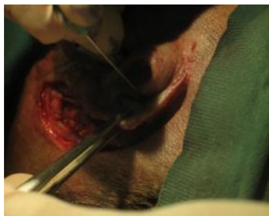
شکل ۹- انتقال نواحی مورد نظر به کمک سوزن بر روی استخوان