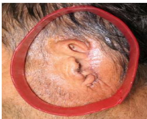
شکل ۱- قالب‌گیری از ناحیه ضایعه

۱- قالب‌گیری اولیه از ناحیه ضایعه در گوش سمت چپ و گوش سمت راست با ماده هیدروکلوئید برگشت ناپذیر (Alginate; Zhermack, SpA, Badia Plesine, Italy) انجام شد. موهای سر بیمار با وازلین تا حد امکان کنار زده شد و در اطراف ناحیه گوش، با موم یک باکس با ارتفاع ۷ سانتی‌متری تعبیه شد (شکل ۱). بعد از قرار دادن ماده قالب‌گیری و قبل از سخت شدن کامل ماده آلژینات، برای ایجاد گیر از تکه‌های کوچک گاز استفاده گردید. سپس گچ سریع سخت شونده نوع یک (پارس دنتال، تهران-ایران) روی آلژینات قرار داده و بعد از سخت شدن آن، قالب برداشته شد.